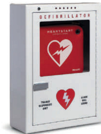
Geräteschrank für die Wandmontage, Premiummodell Produktnummer PFE7024D

Abmessungen: 42 x 38 x 15 cm (B x H x T)