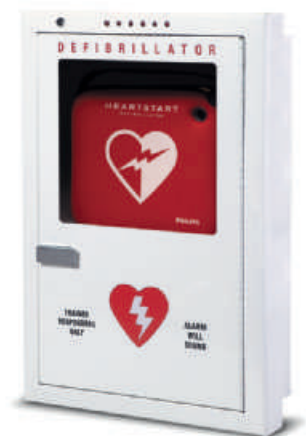
Einbau-Geräteschrank, Premiummodell Produktnummer PFE7023D

Abmessungen: 41 x 57 x 15 cm (B x H x T)